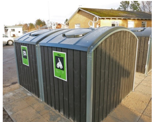
"Genbrugsplet" i Tversted.

De enkelte familiers affald blev vejet to gange i perioden. Vejningerne viste stor forskel på, hvor aktivt de enkelte familier gik ind i arbejdet. Vejningerne viste, at ca. 35 % af husstandene havde under 4 kg restaffald om ugen.