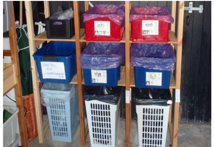
Løsning til sortering indendørs hos en forsøgsdeltager.

Resultater og refleksioner er sammenfattet i rapporten "Nulskrald – et år med mindre affald og mere fællesskab", der kan læses på www.nulskrald.dk .