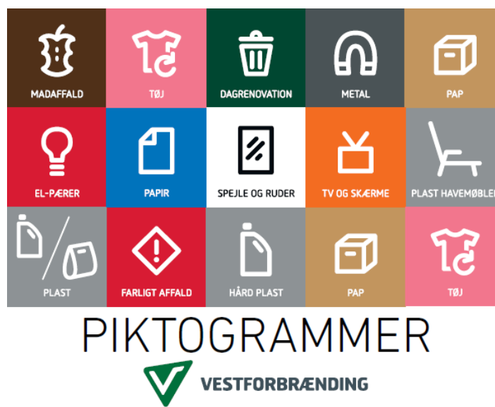
Billede 3 Udsnit af Vestforbrænding's piktogrammer

Genbrugsstationerne er nu inddelt i farvezoner, således at de fraktioner der er beslægtede, findes i samme områder på pladserne.