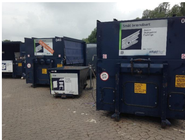
Billede 1 Indsamling af træ på Næstved Genbrugsplads