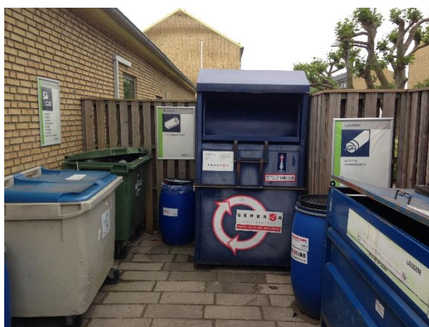
Billede 2 Nærgenbrugsstation Sct. Jørgens Park

Sct. Jørgens Park er et etageboligområde, hvor der har været fokus på at få beboerne til at sortere deres tørre genanvendelige fraktioner. Der er bl.a. blevet etableret nedgravede beholdere suppleret med minigenbrugsstationer, hvor beboerne kan aflevere de fraktioner, der ikke indsamles via de nedgravede beholdere.