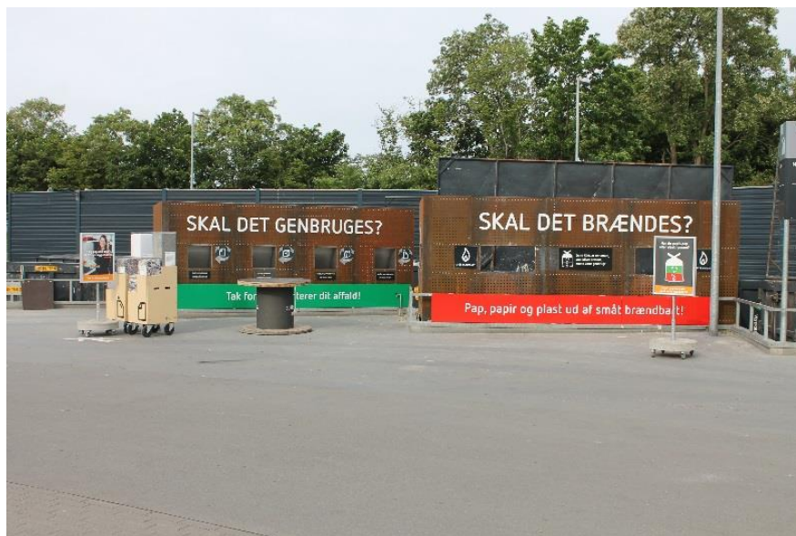
Billede 6 Sorteringsmuren ved Gentofte genbrugsstation

Det sidste besøg var på Gentofte Genbrugsstation, hvor værtskommunen præsenterede deres tiltag med bl.a. en "sorteringsvæg". På Gentofte genbrugsstation var der opstillet en væg foran containeren til brændbart og tilsvarende ved containeren ved siden af.